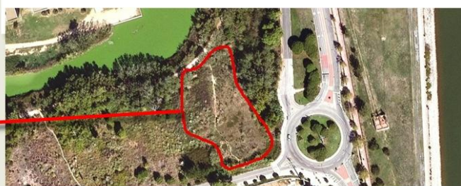
Sector objecte de la intervenció

Forma part d'un conjunt d'equipaments hidràulics amb el paper de basses de laminació per a conduir les aigües, en cas de grans pluges, cap la corredora gran que desemboca en la platja,.