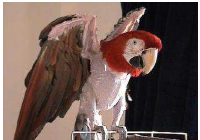
Els lloros captius poden perdre plomatge a causa de l'estrès per captivitat

• Molts dels agents patògens que causen la zoonosi associada als animals de companyia també es poden transmetre a altres animals 19 . Per exemple, l'any 2000, els Estats Units van prohibir totes les importacions de tortugues africanes per tal de protegir el ramat de la hidropericarditis, i també és sabut que la grip aviar és comuna als mercats d'ocells vius i que es pot propagar per mitjà del comerç de flora i fauna salvatge 60 . Tant la hidropericarditis com la grip aviar tenen el potencial de delmar les indústries de bestiar 61,62 .