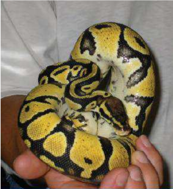
El 90% dels rèptils captius tenen salmonel·losi

L'estudi del 2011 va examinar tres mercats estratègics d'animals salvatges de companyia, un a Alemanya, un a Espanya i un al Regne Unit. Aquest estudi va avaluar el benestar animal, la salut pública i la seguretat, i les potencials espècies exòtiques invasores. L'estudi també incloïa un estudi i crítica bibliogràfics.