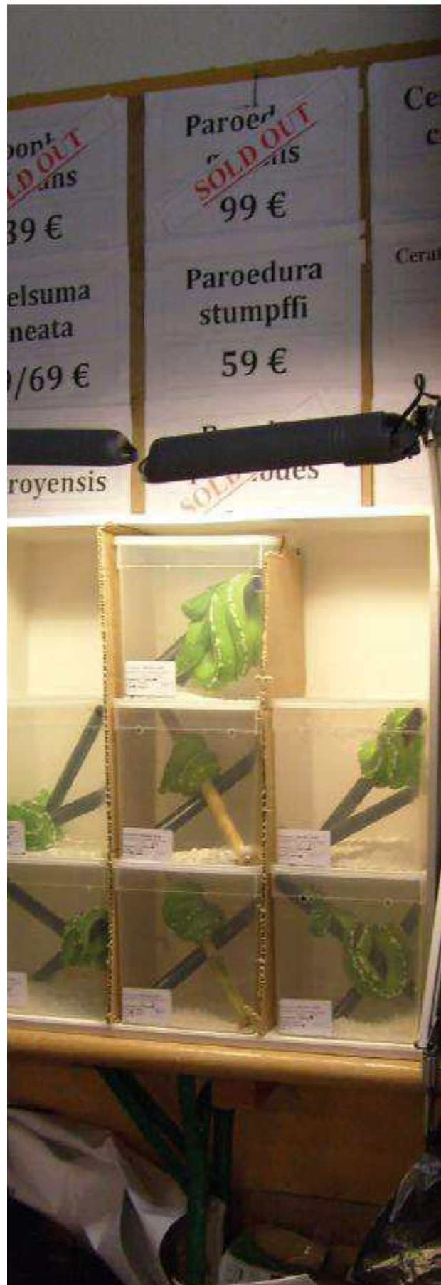
El comerç d'animals vius és impulsat per la promoció comercial i la demanda dels

La freqüència de mossegades de serps verinoses a Europa està creixent, principalment a causa de l'augment en la possessió d'espècies verinoses exòtiques, com ara la serp de cascavell 15,17,76 .