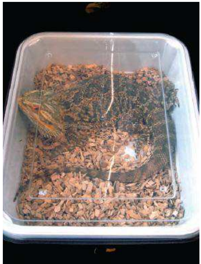
L'estrès per captivitat va ser identificat a tots els mercats, en gran part a causa de les severes restriccions d'espai

Els animals salvatges de companyia s'ofereixen per a la venda a mercats a diferents parts del món, incloent la UE. El 2011, una investigació i avaluació científica de mercats europeus d'amfibis i rèptils va identificar aproximadament cent mercats d'animals salvatges de companyia llistats formalment com existents a la UE (incloent Àustria, Bèlgica, la República Txeca, França, Alemanya, Hongria, Itàlia, els Països Baixos, Eslovàquia, Espanya, Suïssa, i el Regne Unit) 94 , encara que altres investigacions suggereixen que el nombre real d'esdeveniments pot ser considerablement major, amb uns set-cents només a Alemanya 95 .