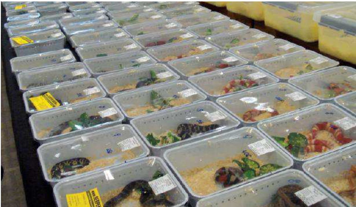
El 75% dels rèptils de companyia moren durant el seu primer any

Els animals salvatges de companyia s'ofereixen per a la venda a mercats a diferents parts del món, incloent la UE. El 2011, una investigació i avaluació científica de mercats europeus d'amfibis i rèptils va identificar aproximadament cent mercats d'animals salvatges de companyia llistats formalment com existents a la UE (incloent Àustria, Bèlgica, la República Txeca, França, Alemanya, Hongria, Itàlia, els Països Baixos, Eslovàquia, Espanya, Suïssa, i el Regne Unit) 94 , encara que altres investigacions suggereixen que el nombre real d'esdeveniments pot ser considerablement major, amb uns set-cents només a Alemanya 95 .