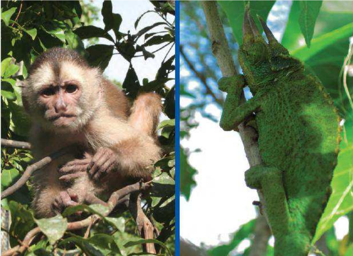
La flora i fauna salvatge pertanyen al món salvatge