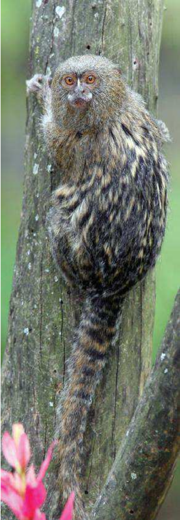
Els titis pigmeus ( Cebuella pygmaea ) son nadius de les selves de Sud-amèrica

La recopilació d'informació actual disponible sobre el comerç d'animals salvatges de companyia a la UE és avui dia insuficient per a permetre una avaluació detallada de l'origen exacte de tots els animals i, per tant, dels impactes de la seva extracció de l'hàbitat salvatge. Això és un problema greu, perquè fa que els clars impactes potencialment perjudicials siguin inquantificables. També hi ha proves que mostren que els permissius sistemes s'estan evadint per a facilitar el comerç il·legal, i per a "blanquejar" els animals del comerç il·legal a dins del sistema. Per exemple: