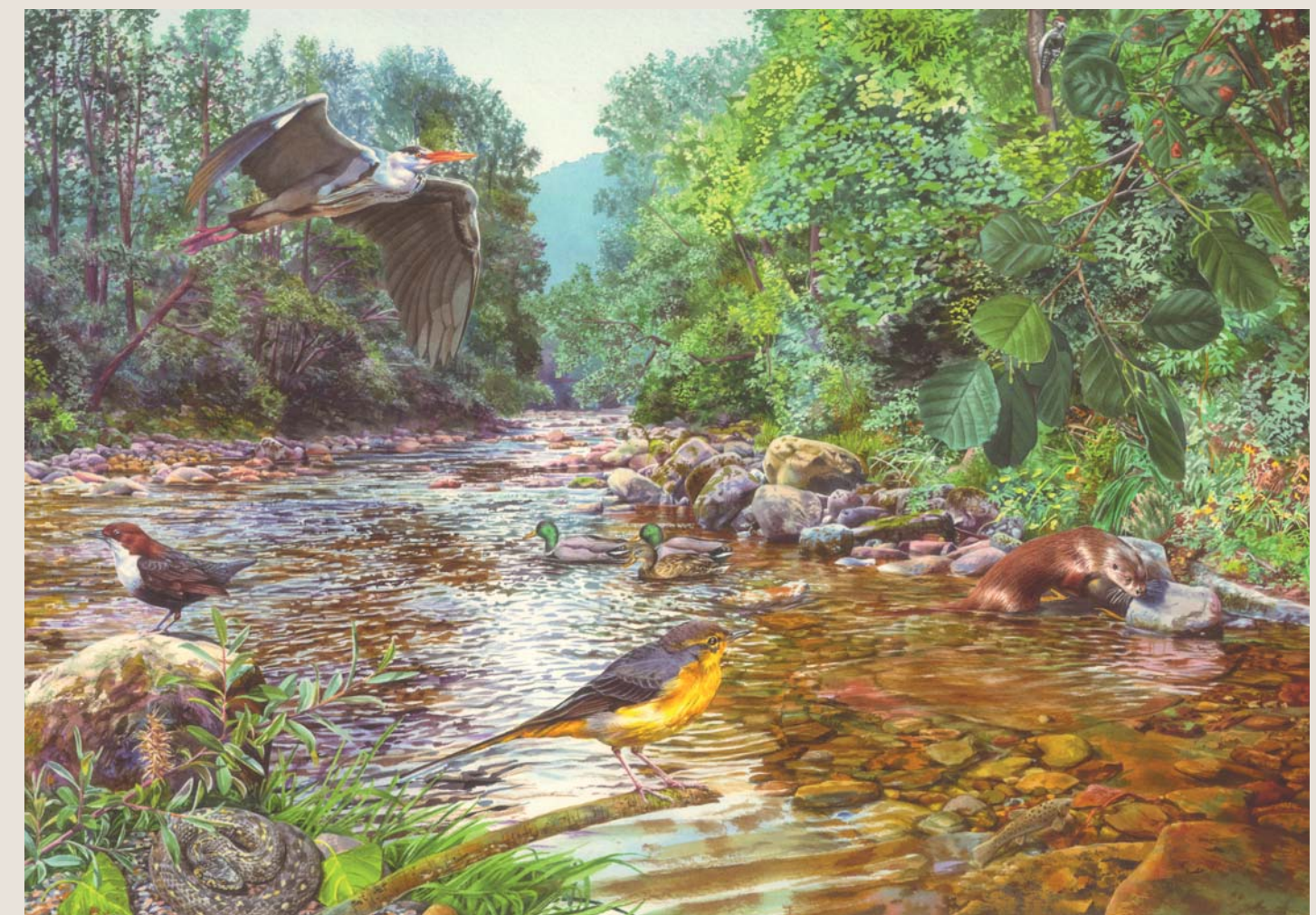
Bòsc de ribèra (Hons de val)