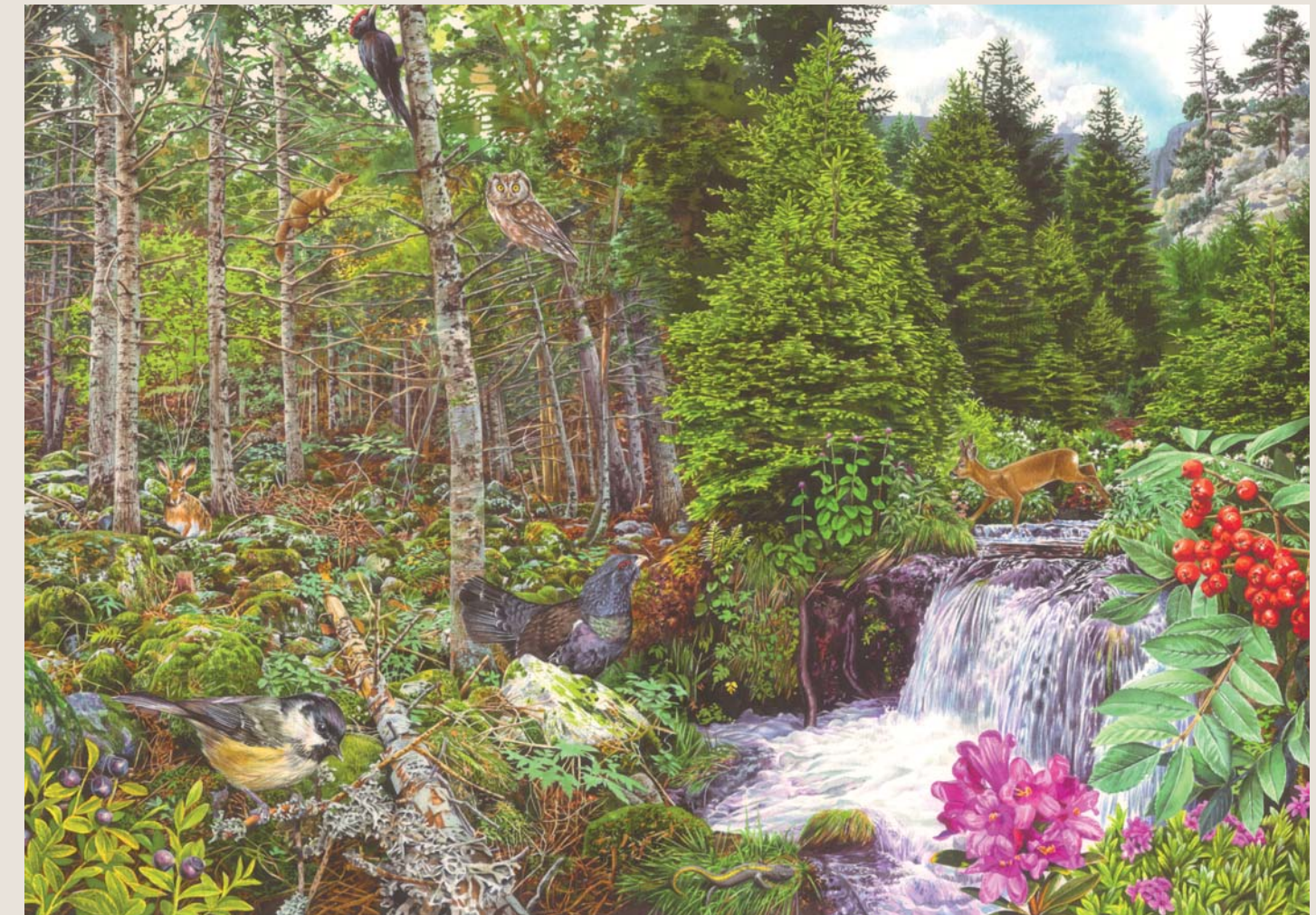
Estatge subaupin (1.600 m - 1.900 m)