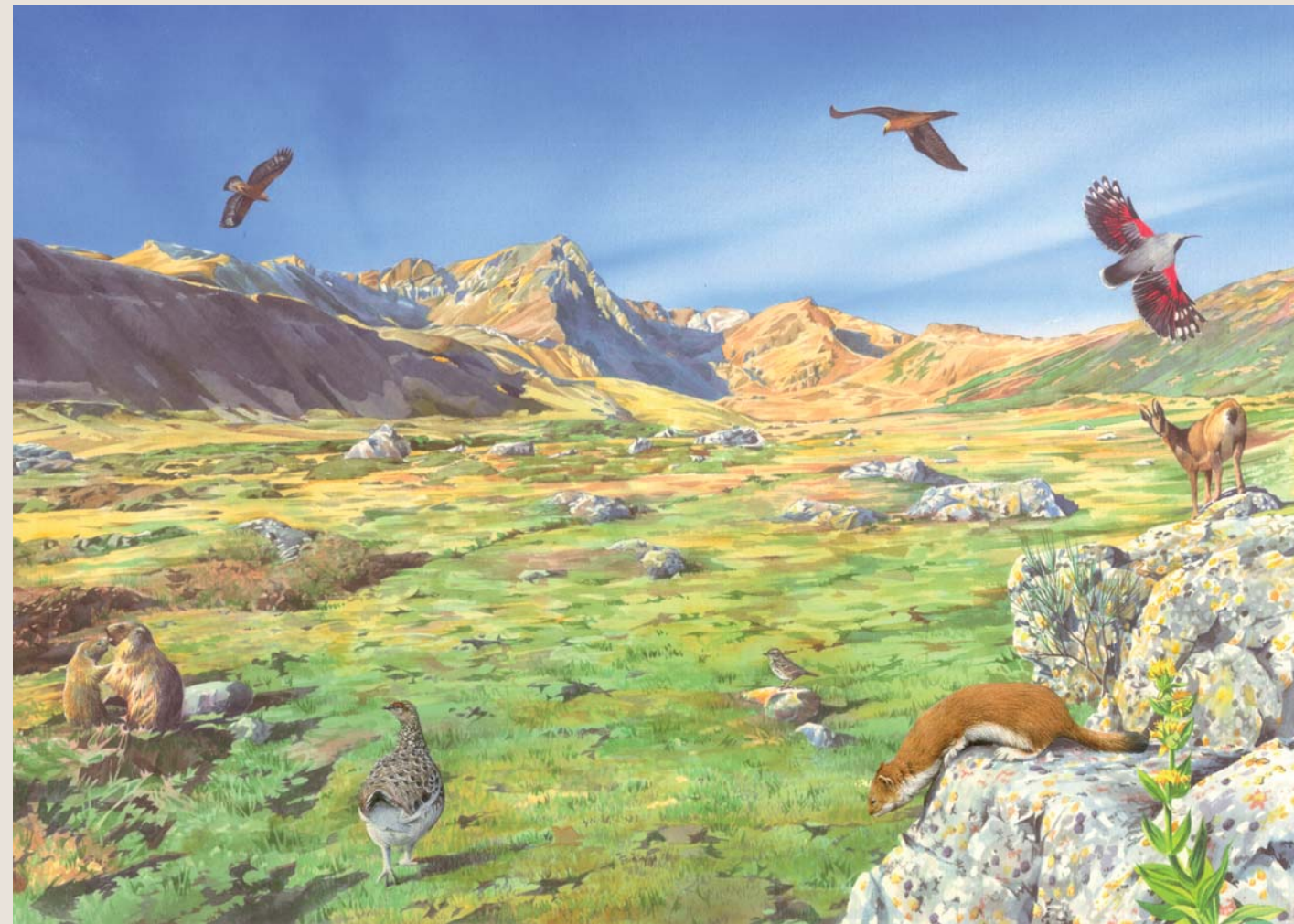
Estatge aupin (1.900 m - 3.000 m)